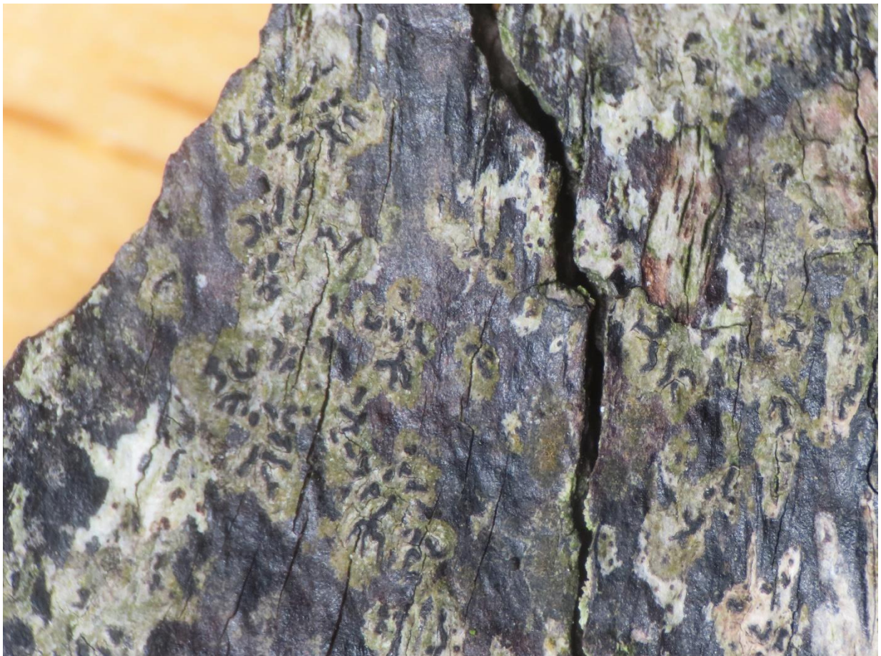
Foto 6: Pseudoschismatomma rufescens (verzonken schriftmos) een tweede “schriftmos”...