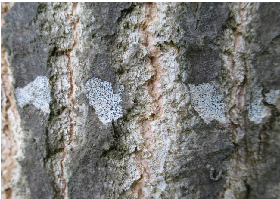
Foto 2: Arthonia radiata (amoebekorst) uiteengereten door de groeiende schors.