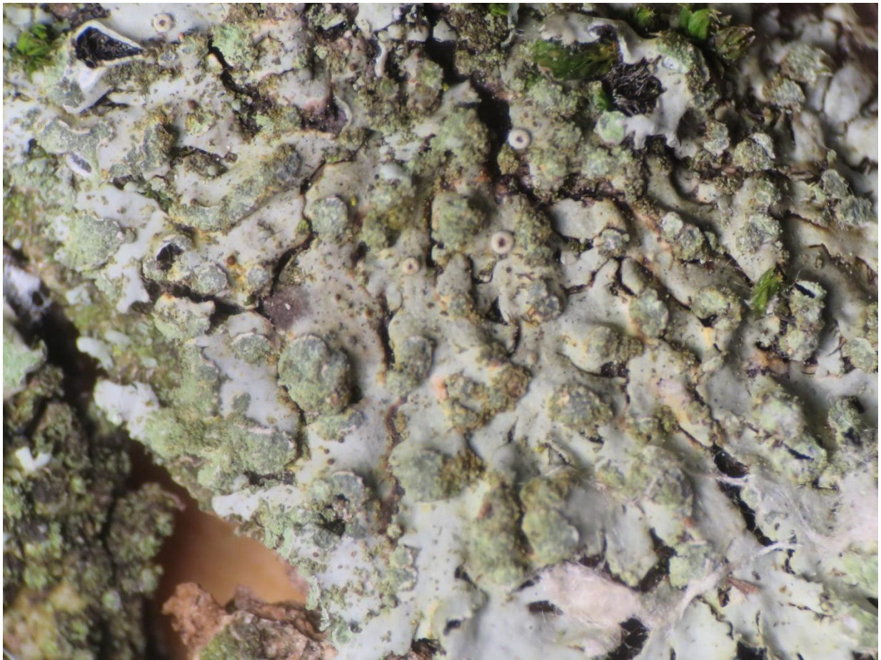
Foto 7: Phaeophyscia orbicularis (rond schaduwmos) met nog wat kleine apotheciën.