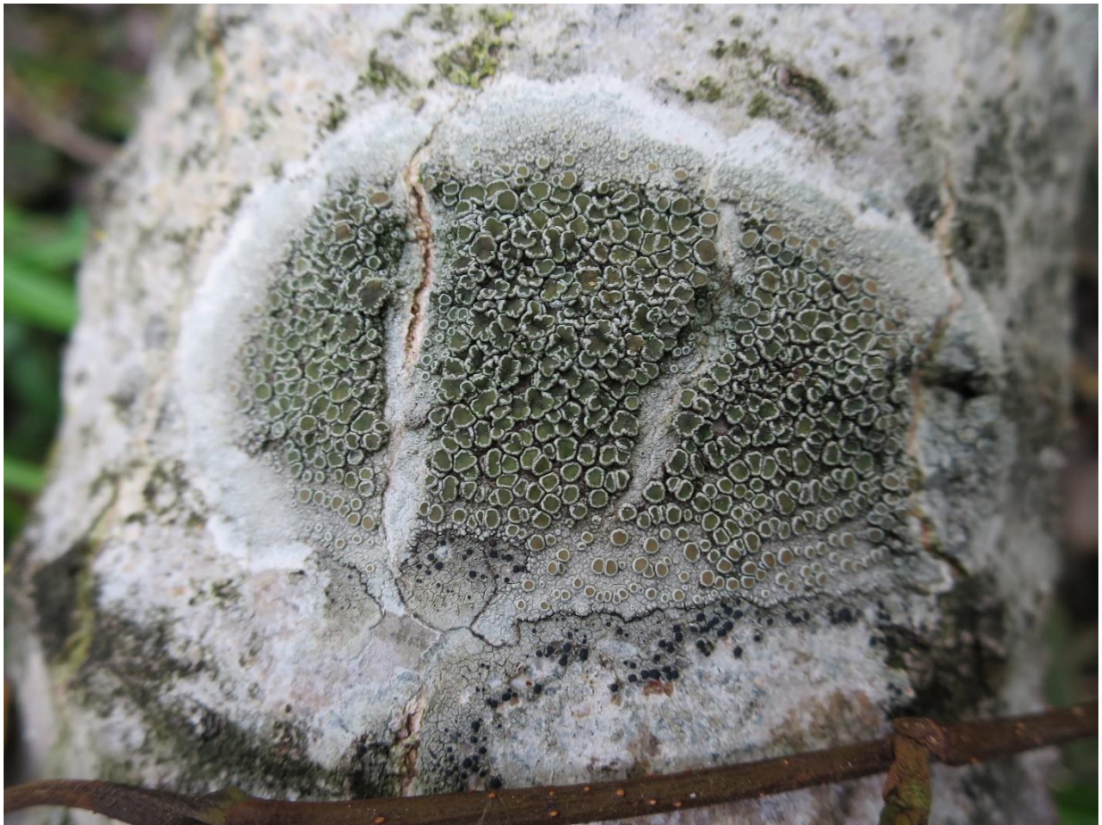
Foto 5: en oudere Lecanora chlorotera (witte schotelkorst) met barsten in de schors