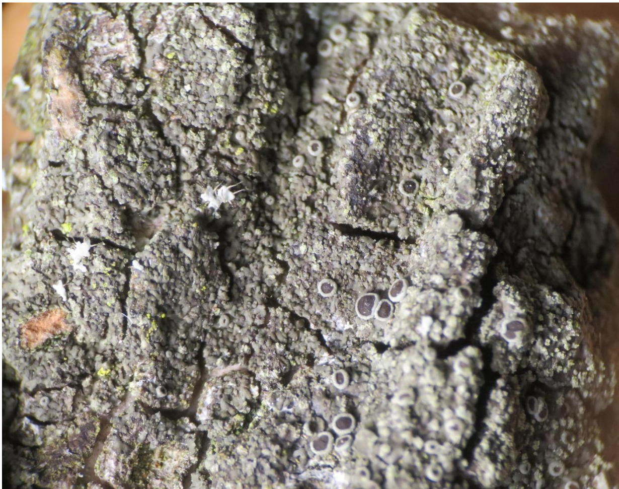
Foto1: Hyperphyscia adglutinata (dun schaduwmos) met apotheciën! Een licheen dat door de klimaatopwarming sterk is toegenomen!