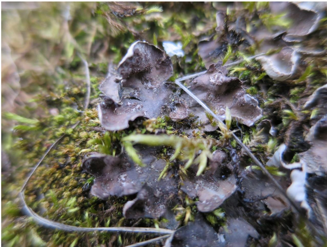
Foto 5: een verweerd exemplaar van Peltigera didactyla ( soredies leermos ) met zijn oude soredieuze plekken.