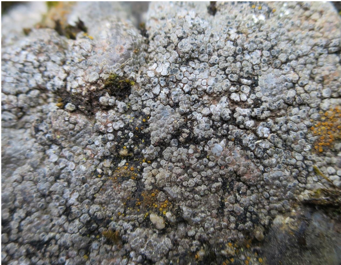
Foto 4: Circinaria contorta (rond dambordje). De wetenschappelijke naam komt van het Griekse 'kirkinos' of het Latijnse 'circinus' = cirkel. Het toevoegsel '-aria' duidt op een gelijkenis. 'contorta' is nog eens een versterking aan deze betekenis: nl. Latijnse 'contortus' = gedraad, of verdraaid. Mooie naamgeving! De Nederlandse naam mag er ook zijn!