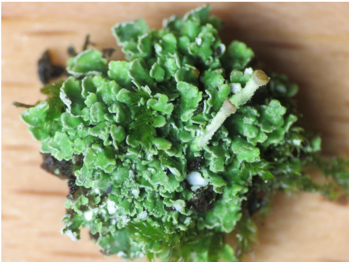
Foto 4: Cladonia humilis (Frietzak- bekermos) op boom zoals we deze ons niet zo vlug voorstellen.