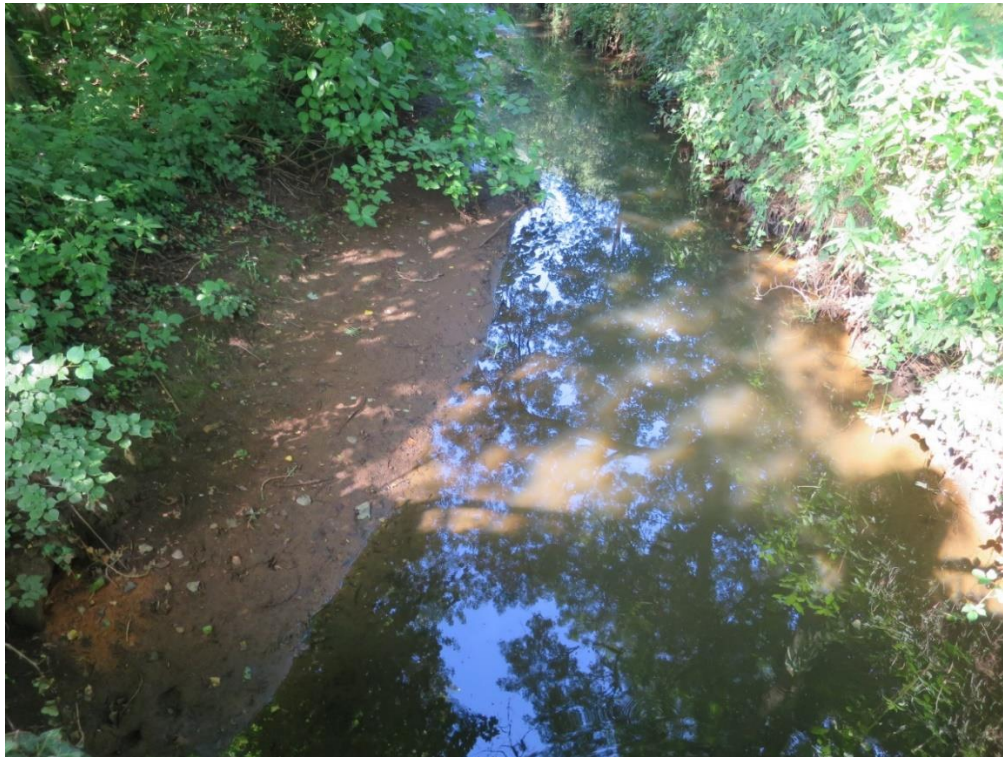
Foto 1: de zeer lage stand van het Groot schijn met blauwe weerkaatsing van de lucht in het water.