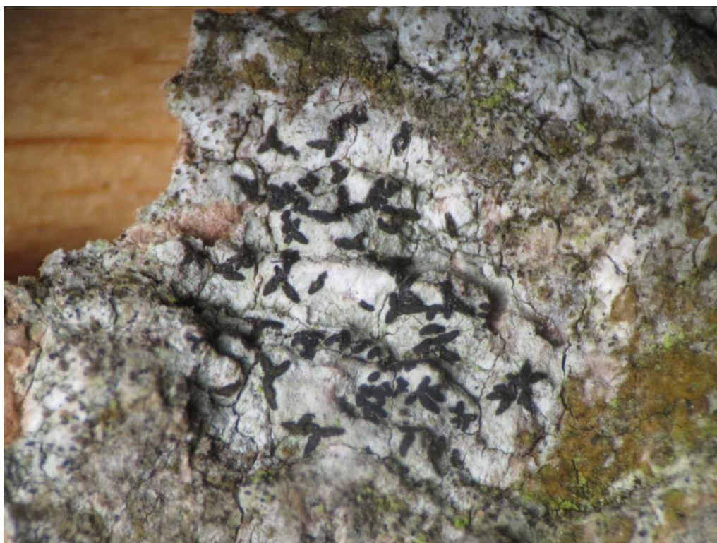
Foto 2: Alyxoria (Opographa) ochrocheila ( geel schriftmos) op populier.