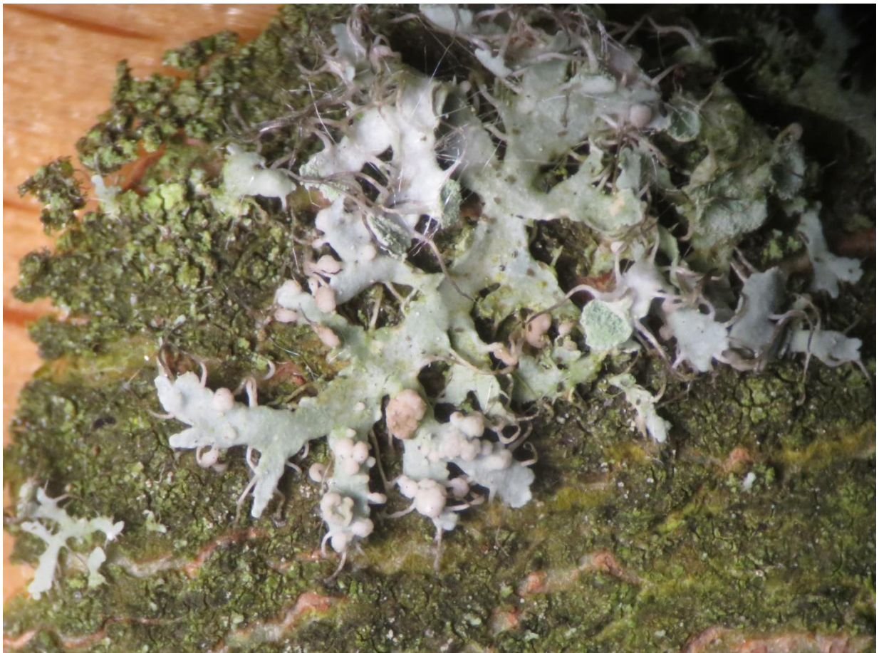
Foto 4: Syzygospora physciacearum (vingermosgalzwam) met lichtbruine gallen op een thallus van Physcia .