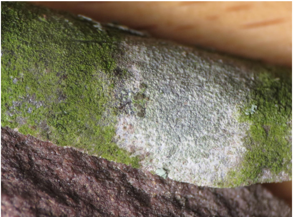
Foto 5: de kleine apotheciën van Lecanora hagenii (kleine schotelkorst).