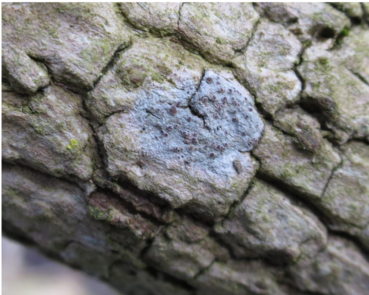
Foto 1: Lecania naegelii (rookglimschoteltje) met zijn bont gekleurde apotheciën.