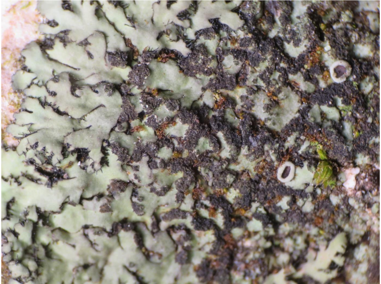
Foto 2: Phaeophyscia orbicularis (rond schaduwmos) met apotheciën!