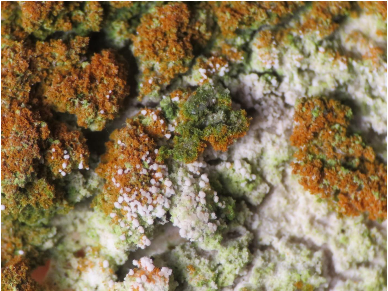
Foto 3: Trentepohlia umbrina (bemerkt de donkerdere kleur in verhouding tot de T. aurea !) met verspreid de witte bolletjes, vruchtlichamen van Burgoa angulosa !