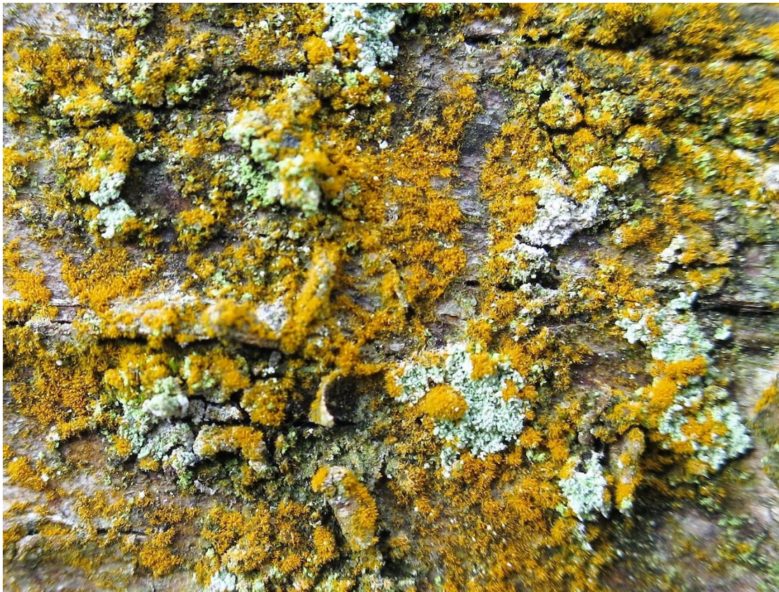
Foto 2: Trentepohlia aurea , een groenalg met caroteen in zich die er “goudkleurig” uitziet en wat “stekelig”, een beetje als een egeltje...