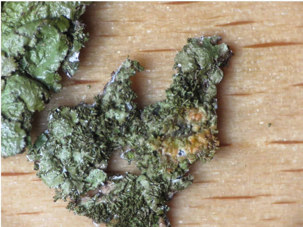
Foto 1: Melanelixia glabratula – Glanzend schildmos. Met C (= Chloor) op het merg is er een snelle roodverkleuring maar als men een foto wil maken moet men vlug zijn. De verkleuring was al sterk verminderd en er is maar een roze schijn overgebleven.