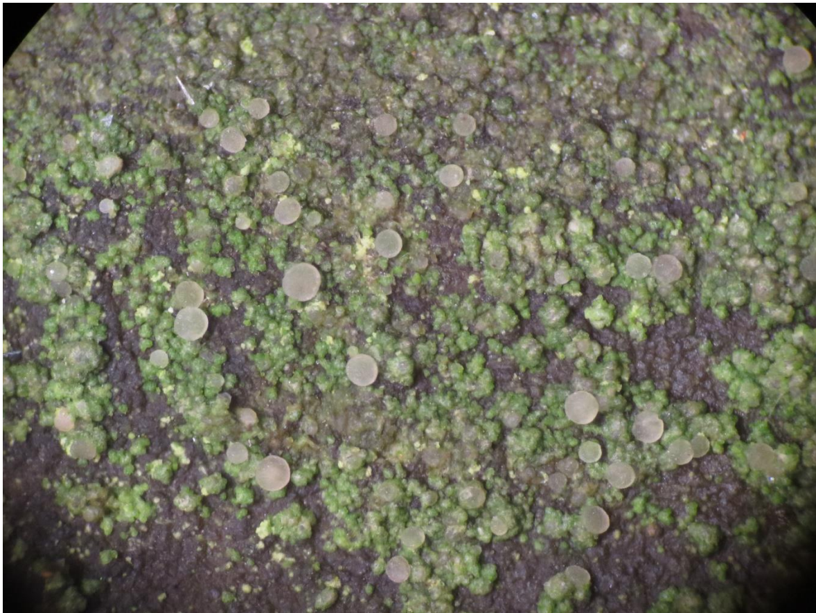
Foto 4: Bacidina chloroticula - Gladde knoopjeskorst, een vergroting x 30. De kleine apotheciën zijn kleurloos en maar een 0,3 mm hier.