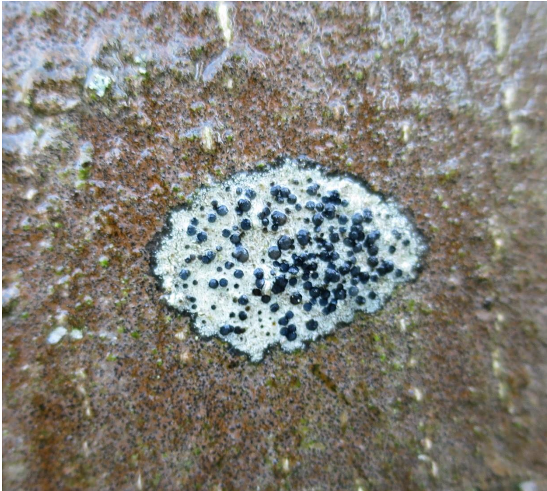
Foto 2: Lecidella elaeochroma -Gewoon purperschaaltje in vochtige toestand omgeven door Opegrapha rufescens -Verzonken schriftmos. Merk de sterke zwarte prothallus !