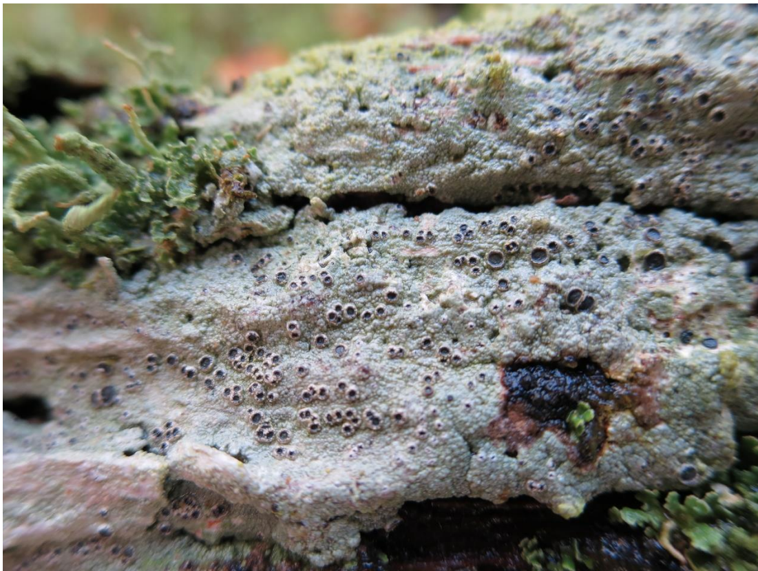
Foto 3: Diplochistes muscorum – Duindaalder, die parasitair op Cladonia begint!