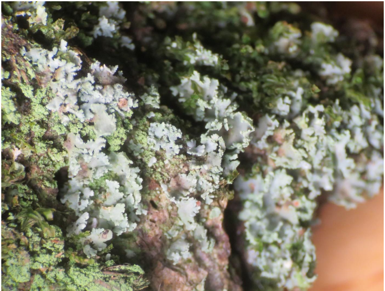
Foto 1: Cladonia caespiticia (greppelblaadje) met zijn ingesneden blaadjes.