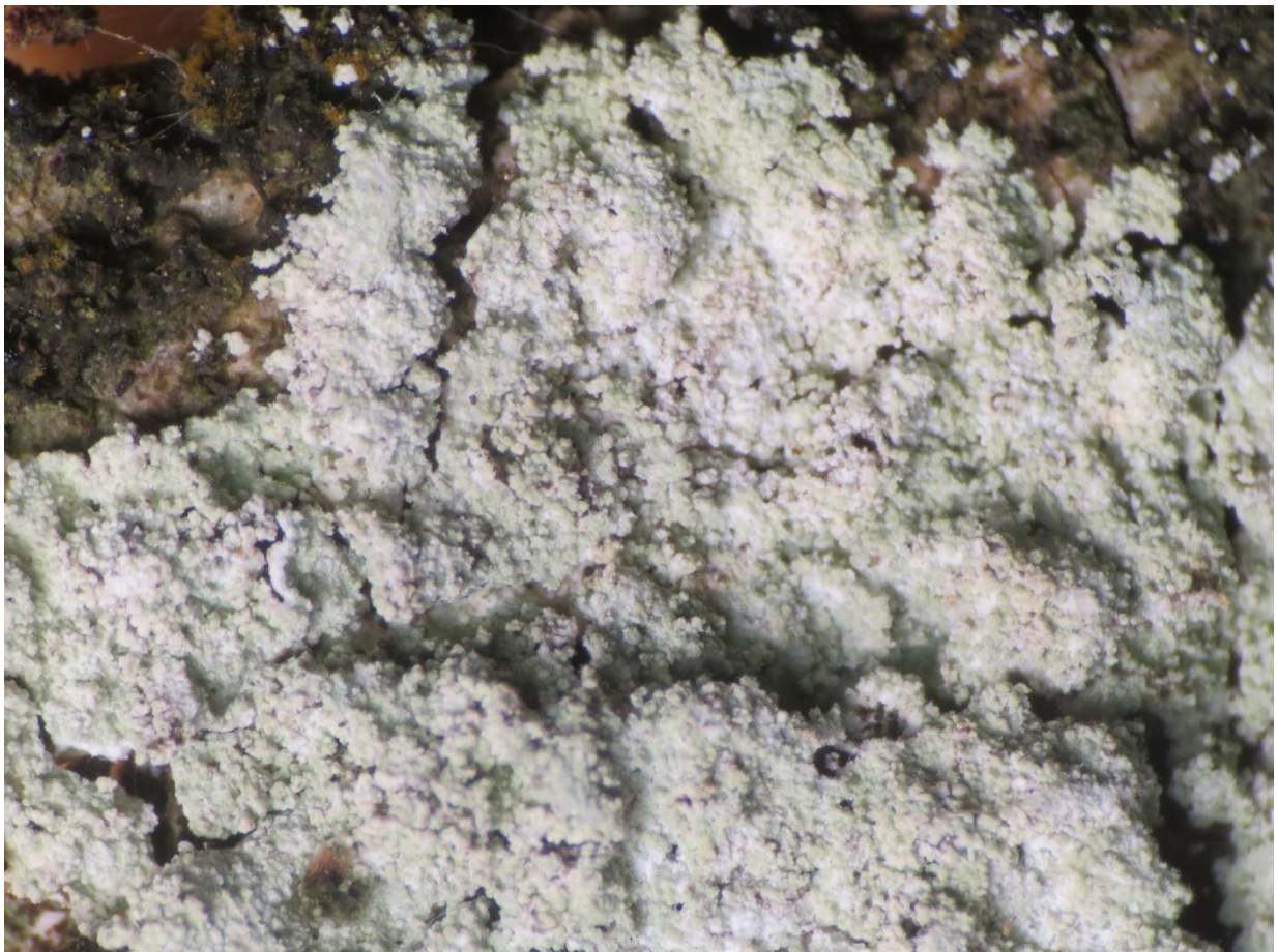
Foto 6: Lepraria rigidula (grove poederkorst). Door uitstekend hyphen een donzig uitzicht. (x10)