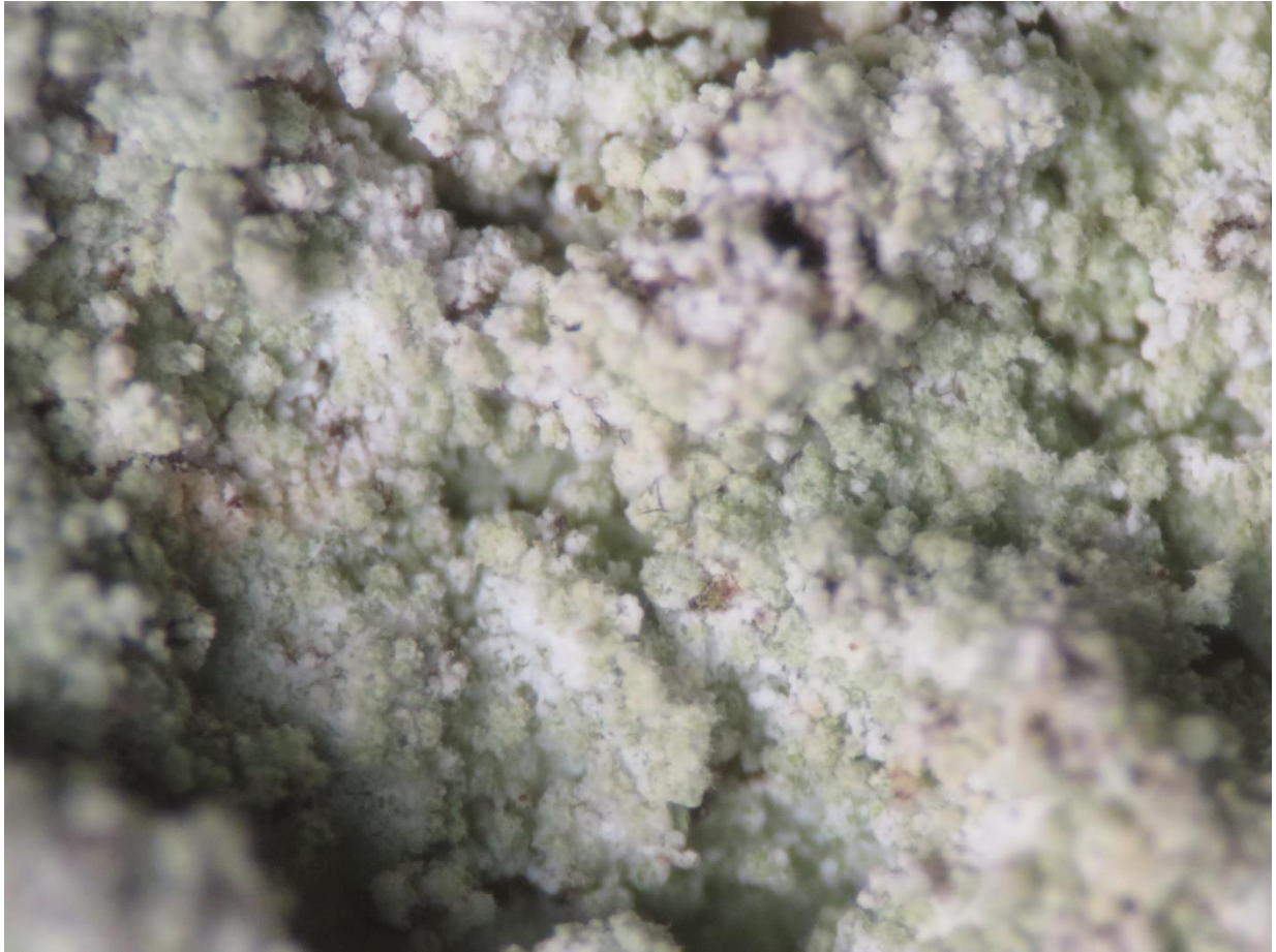
Foto 7: Lepraria rigidula (grove poederkorst) x 30 een zeer donzig uitzicht door uittredende hyphen.