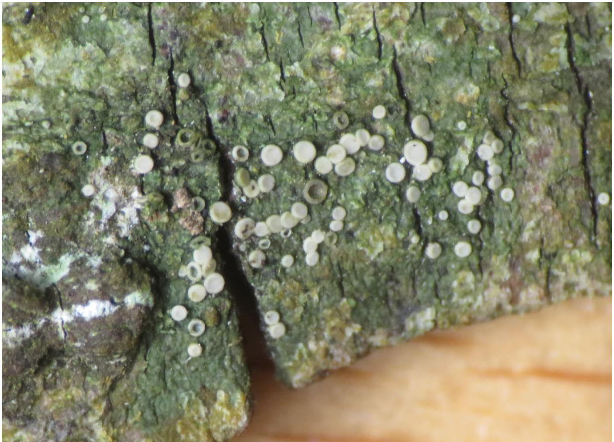
Foto 8: Coenogonium pineti (valse knoopjeskorst) met heel veel apotheciën in alle maten...