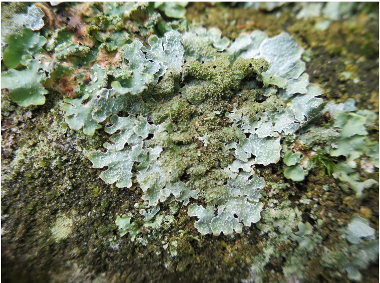
Foto 8: Parmelia saxatilis (blauwgrijs steenschildmos) op Amerikaanse vogelkers! Let ook op de sterke aanwezigheid van de pseudocyfellen op de eindlobben!.