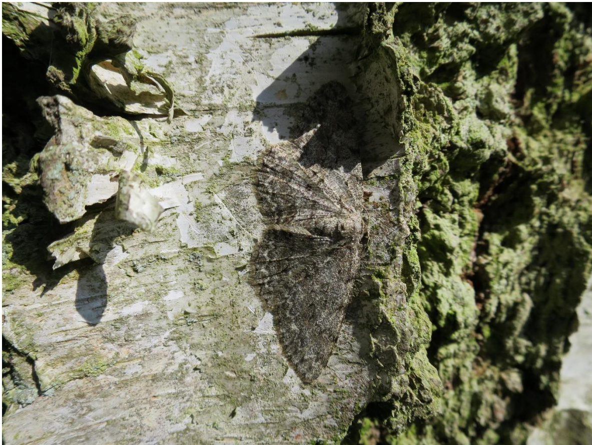
Foto 2: Hypomecis punctinalis (ringspikkelspanner) op dezelfde berk!