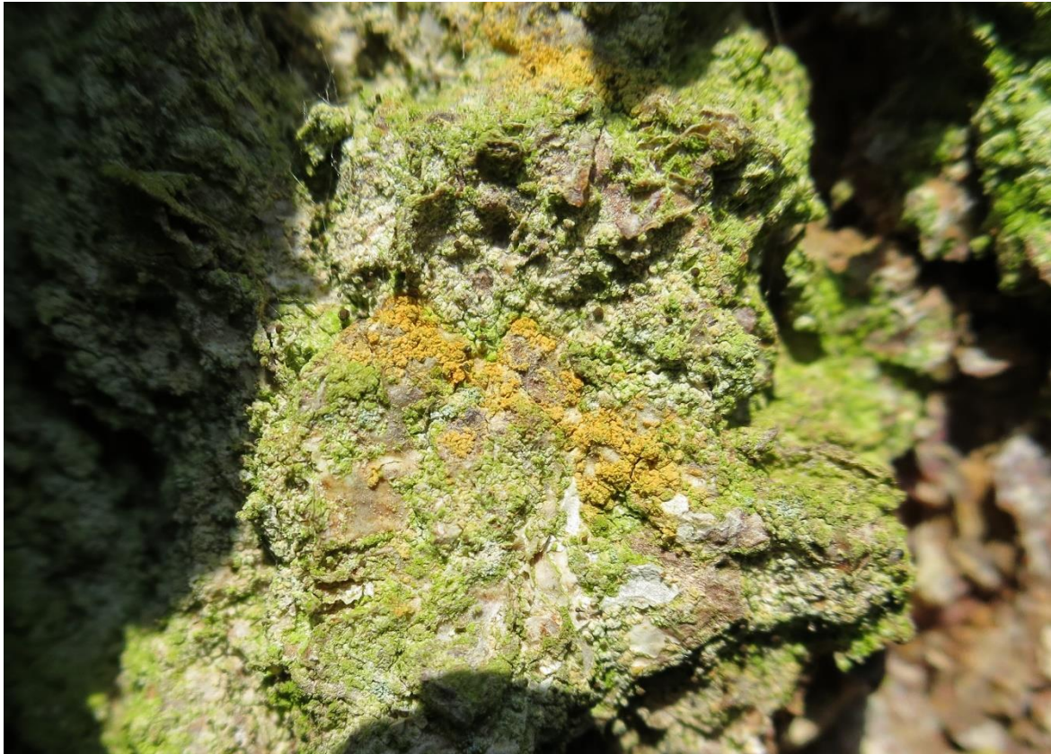
Foto 1: Chaenotheca ferruginea (roestbruin schorssteeltje) op berk!