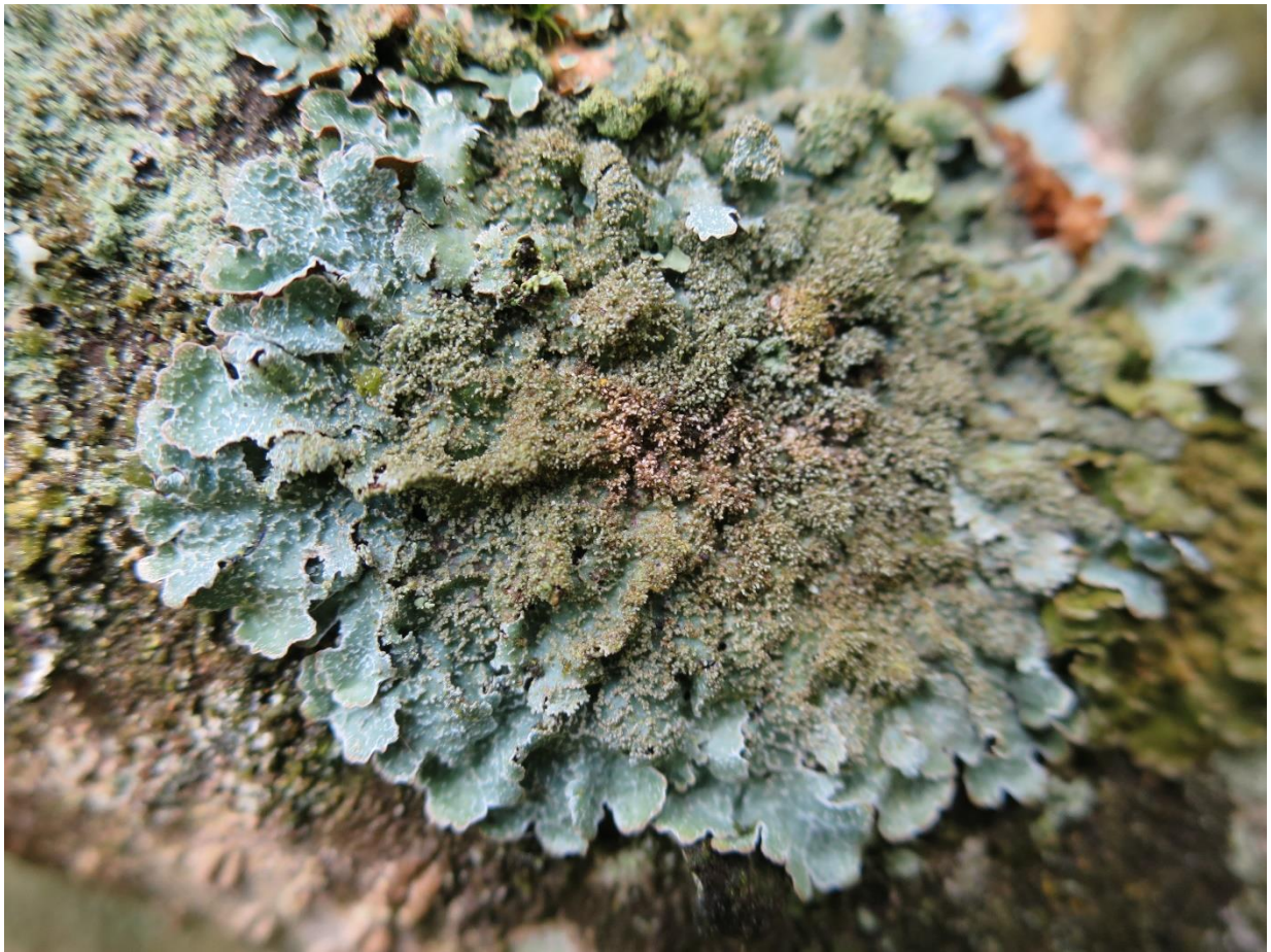
Foto 7: Parmelia saxatilis (blauwgrijs steenschildmos) op Amerikaanse vogelkers!